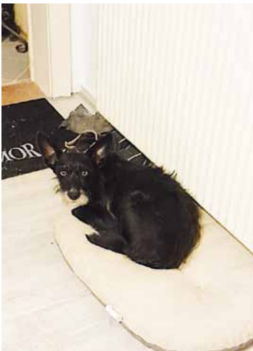
„Pino“, ein schüchterer achtjähriger Mischling, fand bei unseren ehemaligen zwölf Jahre alten Hundeschwestern „Mica“ und „Pippa“ ein behütetes Zuhause, wo er Vertrauen nach seinem eigenen Tempo aufbauen kann.