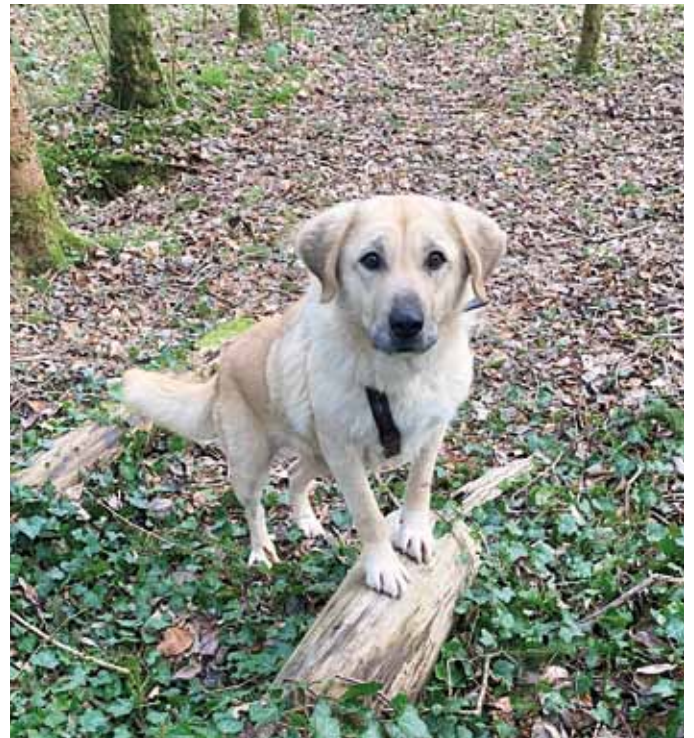
„Naila“ (geb. am 7. Juni 2014) war ein ehemaliger Straßen- und Zwingerhund. Nun wird sie geliebt und weicht ihrem Herrchen nicht von der Seite.