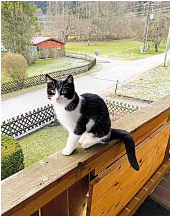
„Pippi Lotta“ (geb. im Mai 2023) als Fundtier abgegeben, nun in ihrem neuen Zuhause.