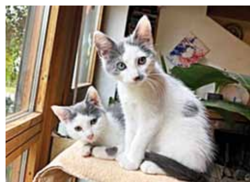
Foto rechts: ‚Bilbo‘ und ‚Frodo‘ kamen am 2. August 2023 im Tierheim zur Welt und konnten dann am 2. Oktober zu ihren neuen ‚Dosenöffnern‘ umziehen.

‚Ennio‘, der fünfjährige Springer-Spaniel, wurde von uns aus einem befreundeten Tierheim übernommen und konnte nach einiger Zeit vermittelt werden (die Hundedame stammt übrigens auch von uns).