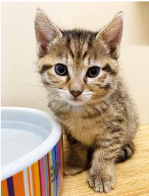
Kätzchen ‚Shari‘ (geb. 4. Oktober 2023)

‚Skinny‘ wurde trächtig gefunden und brachte schließlich am 4. Oktober 2023 drei Kätzchen zur Welt. Nachdem die Kleinen alt genug waren und abgegeben werden konnten, wurde sie kastriert und ebenfalls der neuen Familie übergeben, wo sie nun ‚Sissi‘ gerufen wird.