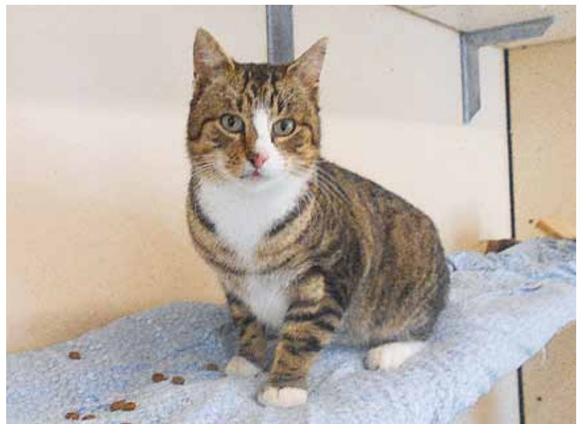
„Fritzi“, geschätzte fünf Jahre, wurde mit weiteren Katzen in einer Rettungsaktion von einem bereits verlassenen Bauernhof gerettet. Zwei der Katzen, die zugänglich waren und Hilfe zuließen, konnten nach tierärztlicher Versorgung zu neuen Besitzern umziehen.