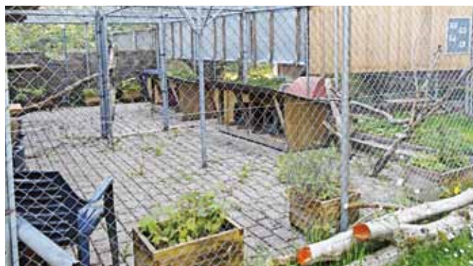
„Urlaub daheim“: unsere Katzenpension im Grünen

Voraussetzungen: Die Tiere werden nur in gesundem Zustand in Pension genommen, nur in Notfällen krank. Katzen dürfen nicht rollig sein und müssen eine gültige Dreifach-Impfung haben, die