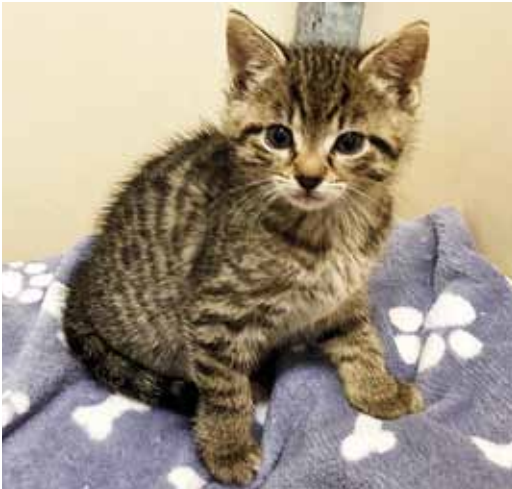
Katerchen ‚Kito‘ (geb. 4. Oktober 2023)