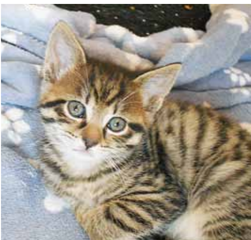
Kätzchen ‚Rani‘ (geb. 4. Oktober 2023)